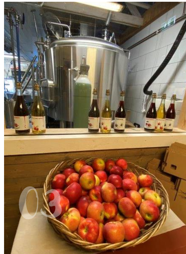
Most- og siderproduksjon