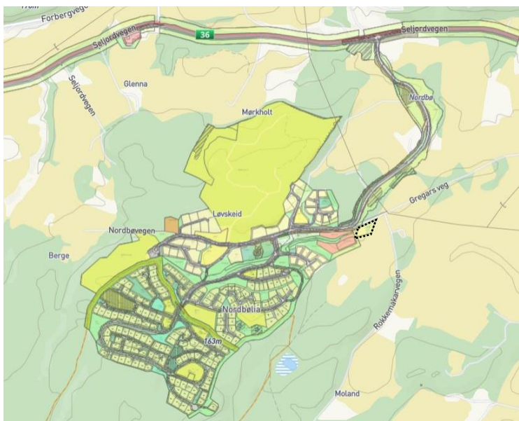
Kartutsnitt som viser områdeplan for Nordbøåsen. Planområdet for reguleringsendring ligger på østkanten av områdeplan og er markert med svart stiple linje.

Forslagstiller har gjort en vurdering etter forskriftens §6, og konkluderer med at prosjektet ikke vil få vesentlige virkninger for miljø og samfunn, og at det ikke er behov for KU etter forskriften.