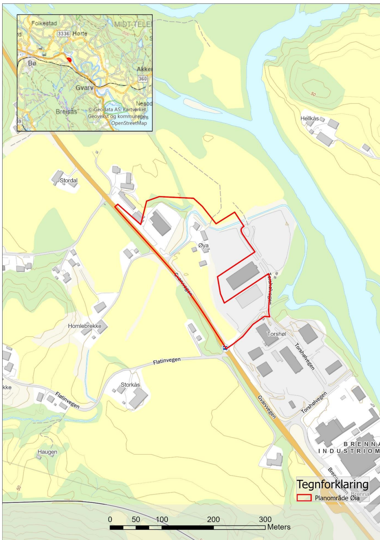
Kart 1: Planområdets utstrekning (stort kart) og plassering i kommunen (lite kart).