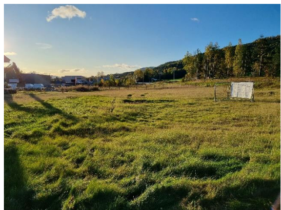
Foto 1: Montasje med bilder fra planområdet