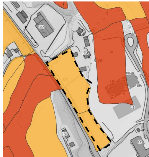
Figur 3. Jordkvalitet (Nibio). Gul = god, Rød= svært god, grå=ikke registrert