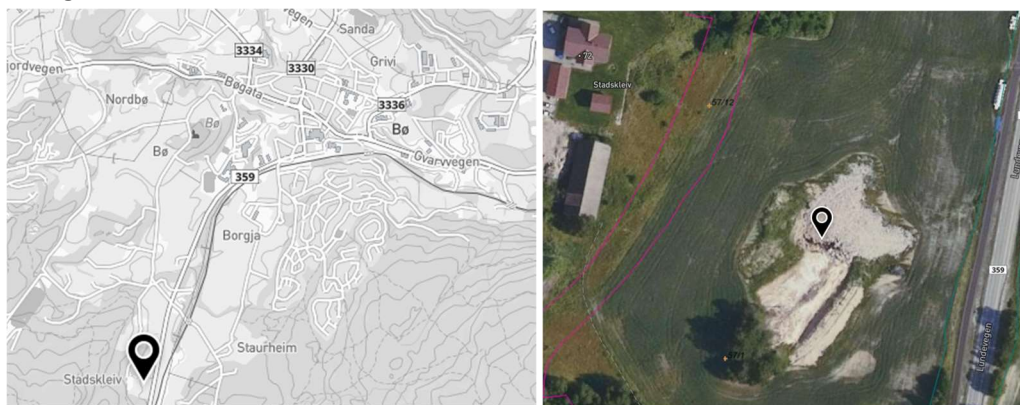
Figur 5. Til venstre: mottaksområdet i forhold til Bø sentrum. Til høyre: flyfoto av mottaksområdet

Brenna Næringspark AS sørger for nytt areal for disponering av matjord. Mottaksområdet er på Stadskleiv og er avklart med Midt-Telemark landbrukskontor. Volumet matjord som skal flyttes er beregnet til litt i overkant av 900 m 3 .