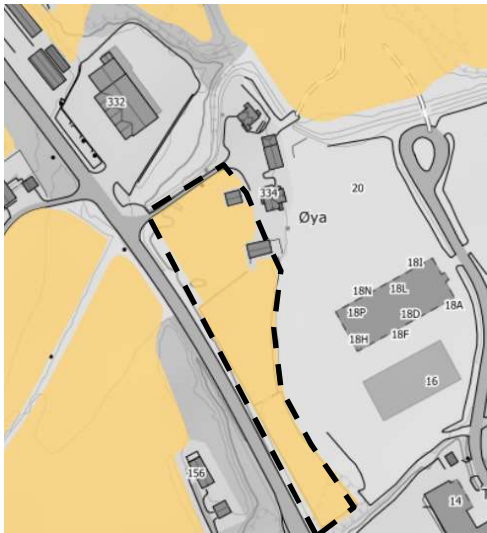
Figur 2. Markslag (Nibio). Gul= fulldyrka.

Mulighet for forekomster av plantesykdommer er vurdert i samråd med landbrukskontoret. Arealet er ikke brukt til kornproduksjon, grønnsaker eller poteter, og forekomster av plantesykdommer vurderes derfor som lite sannsynlig. Området er heller ikke oppført i PCN-register. Det er ikke registrert forekomster av floghavre.