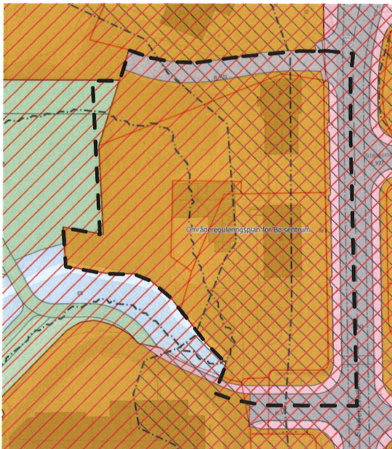
Figur 2 Planavgrensning vist over områdereguleringsplan for Bø sentrum

Planforslaget vil i hovedsak være i tråd med områdereguleringsplan for Bø sentrum og utløser ikke krav om konsekvensutredning etter plan- og bygningsloven §4-1.