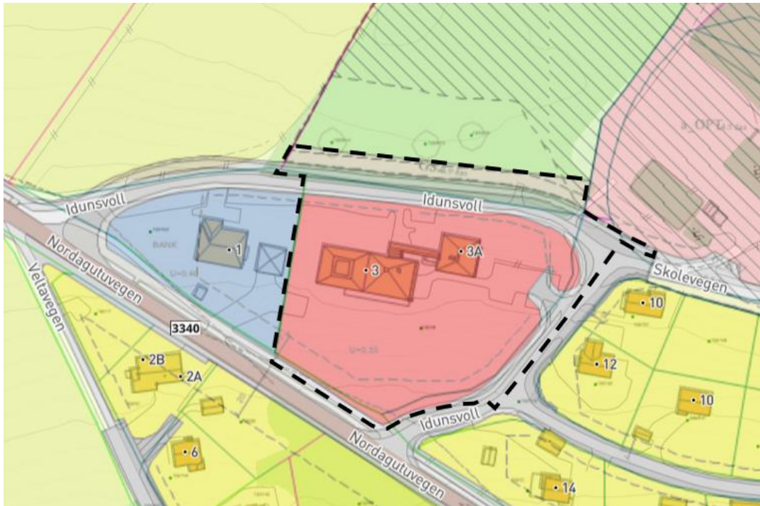
Kartutsnittet som viser foreslått plangrense med gjeldende reguleringsplaner som bakgrunn.

Det påpekes at endelig planområdet kan bli mindre enn det som vises her, men siden detaljer ikke avklart i denne fasen, tas det med et større areal enn nødvendig for å unngå ny varsling.